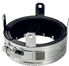
Imagem de exemplo